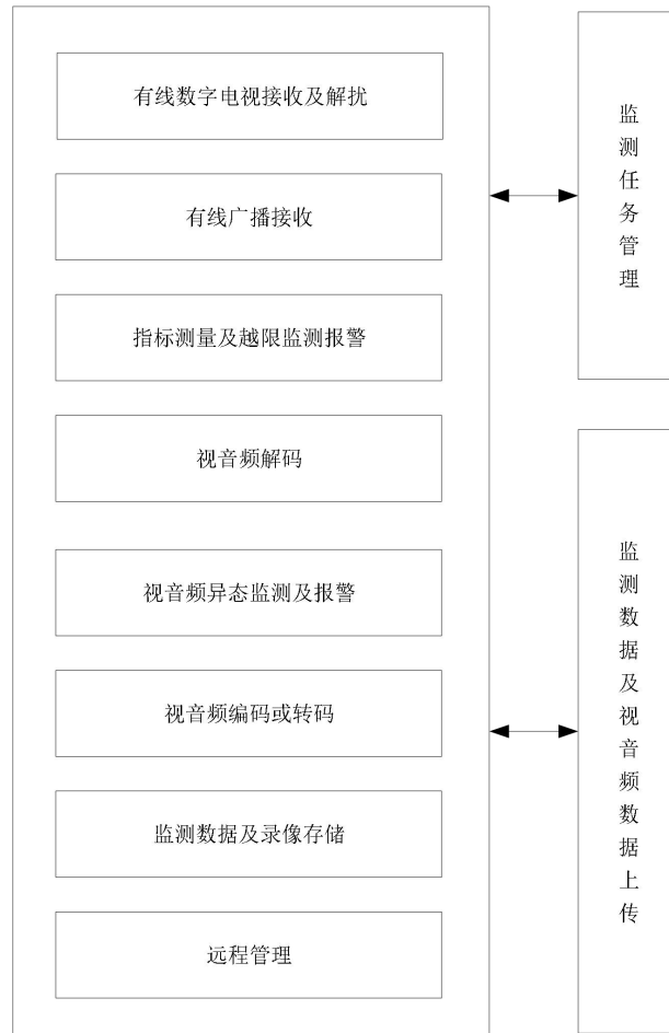
图 3.0.2 有线电视监测前端组成框图

2 监测前端应配置有线数字电视接收及解扰、有线广播接收、指标测量及越限监测报警、视音频解码、视音频异态监测及报警、视音频编码或转码、监测数据及录像存储和远程管理等功能模块，并具有功能扩展能力。监测前端组成框图如图 3.0.2 所示。